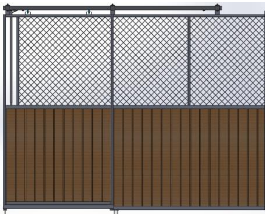
Basmodell - Galvad med granplank. Skjuddörr.