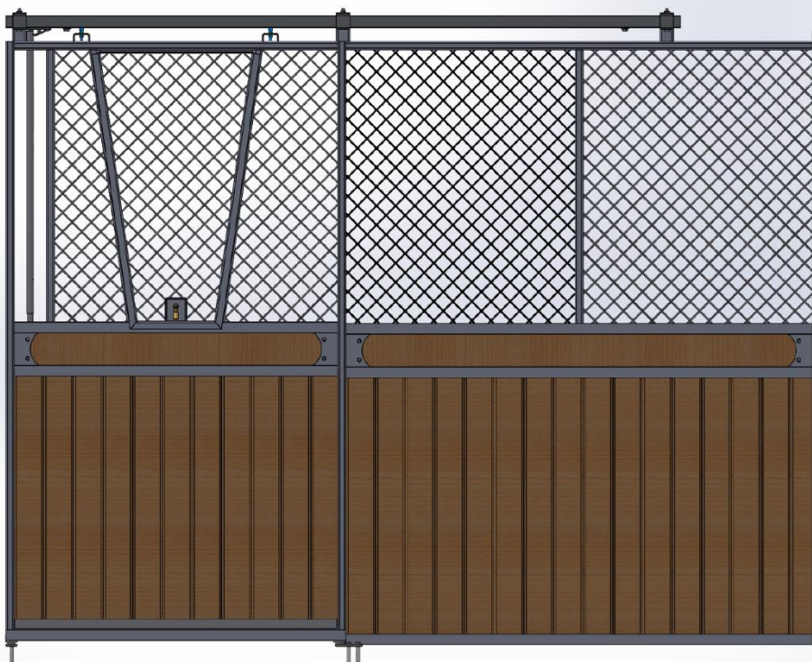
Ruter Knekt - Galvad med granplank och dekorationsbräda samt öppningsbar lucka i fronten som kan hakas av.