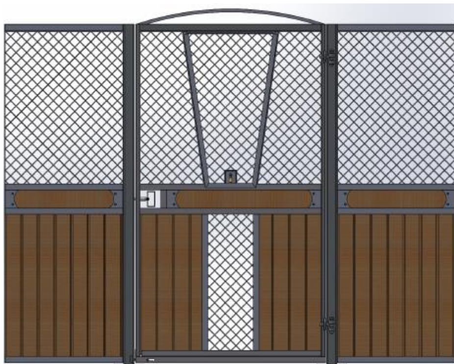
Galvad med granplank, dekorationsbräda, båge över dörren, ljusinsläpp i front. V-front i dörr som går att haka av.