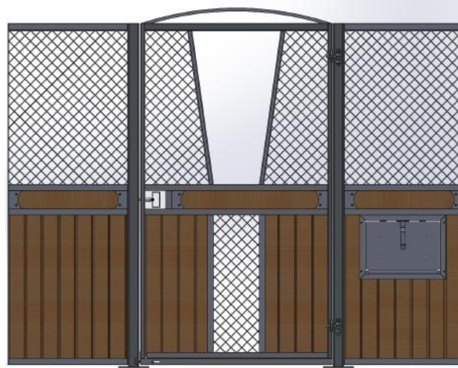
Samma front som till vänster där man har hakat av den V formade luckan.

Ruter Kung med stående ruter, säkerhetstestat med simulerad hästspark, slagdörr, massor av möjligheter; dekorationsbräda, båge över dörren, ljusinsläpp i fronten, V formad lucka i dörren som kan hakas av, vippkrubba, ek och plastplank, svartlack. Kan matchas med Ruter Dam.