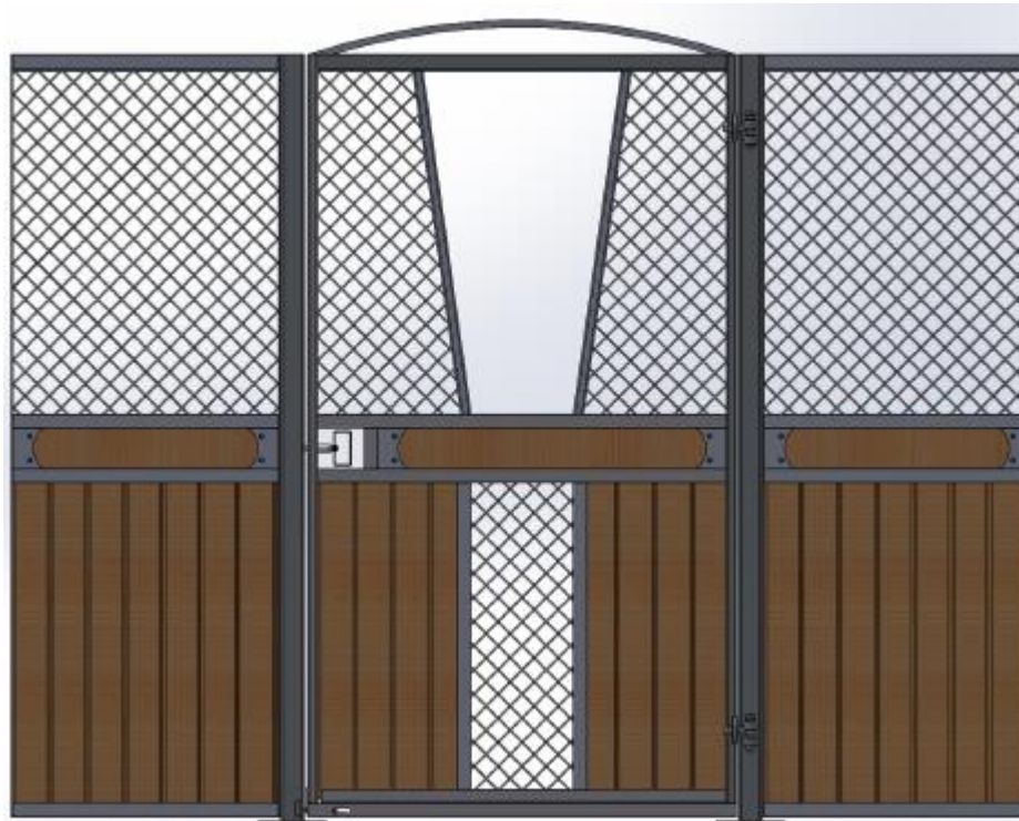
Samma front som till vänster där man har hakat av den V formade luckan.

Ruter Kung med stående ruter, säkerhetstestat med simulerad hästspark, slagdörr, massor av möjligheter; dekorationsbräda, båge över dörren, ljusinsläpp i fronten, V formad lucka i dörren som kan hakas av, vippkrubba, ek och plastplank, svartlack. Kan matchas med Ruter Dam.