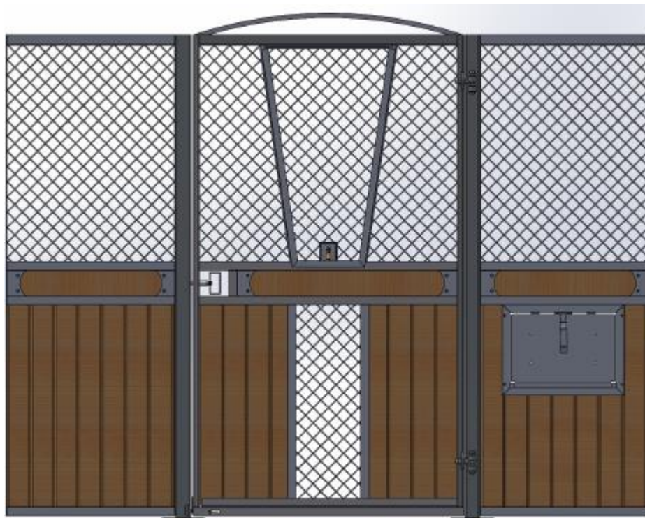
Galvad med granplank, dekorationsbräda, båge över dörren, ljusinsläpp i front. V-front i dörr som går att haka av. Vippkrubba.