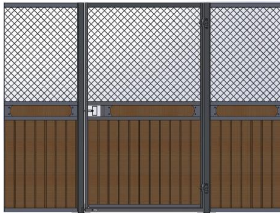
Galvad med granplank, dekorationsbräda.

Ruter Kung med stående ruter, säkerhetstestat med simulerad hästspark, slagdörr, massor av möjligheter; dekorationsbräda, båge över dörren, ljusinsläpp i fronten, V formad lucka i dörren som kan hakas av, vippkrubba, ek och plastplank, svartlack. Kan matchas med Ruter Dam.