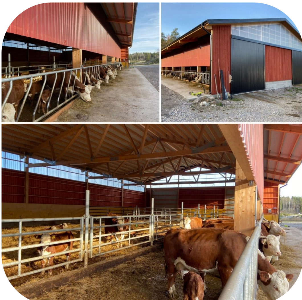
Skrapgång inkl. klövpall har som standardbredd 4 meter

Fler bilder och inspiration på vår Facebooksida BruksbalkenVarnamo samt instagram bruksbalken.