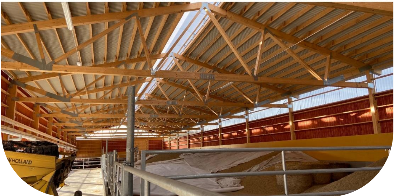
Exempel ventilerad nock med ljusinsläpp. Den perforerade plåten i bakvägg syns väl på detta foto.