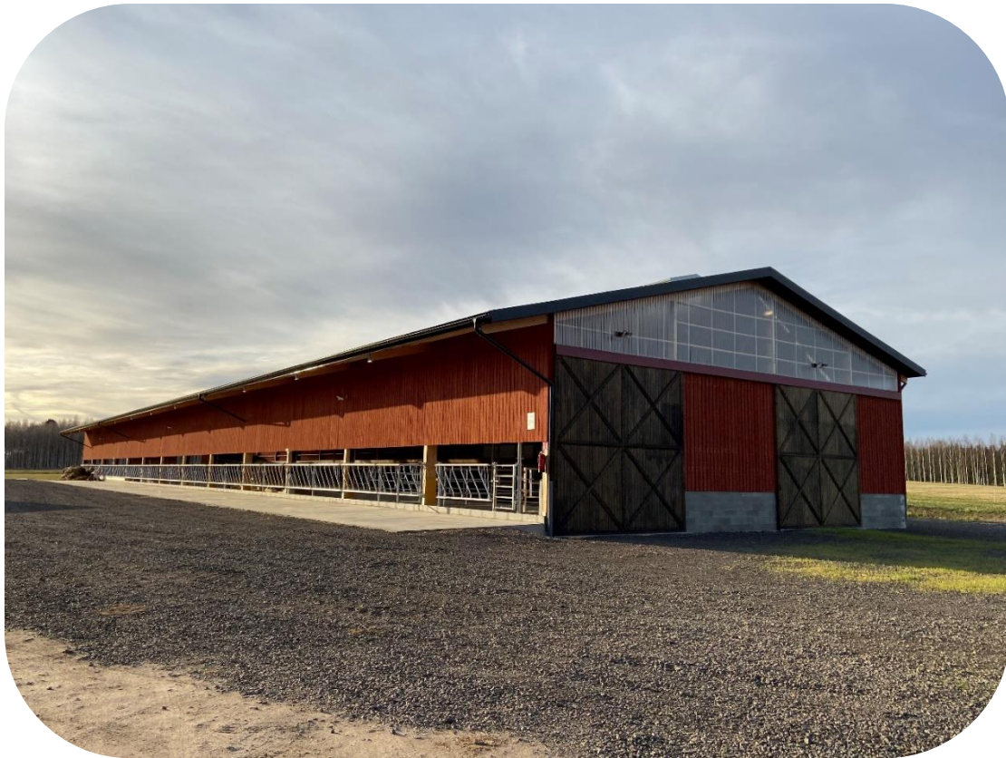
Exempel ljusinsläpp i gavel