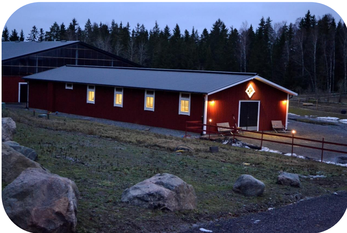
Privatstall med 8 boxar, sadelkammare, spolspilta, förråd och övernattningsrum. Vita fabriksmålade fönster och grundmålad ytterpanel vid leverans.

Bruksbalkens stall har en mycket genomtänkt funktion. Stallet kan i princip byggas hur långt som helst och kan anpassas till travverksamheten och till ridskolans speciella behov om så önskas. Stallet består av minimum 4 boxar/utrymmen och kompletteras sedan med de behov man har utöver boxarna, exempelvis sadelkammare, spolspilta, foderkammare, samlingsrum, torkrum, toalett, kontor etc. Ofta förlänger vi byggnaden med ett oisolerat förråd som kan användas till foder, lösdrift, carport, verkstad mm. Djupet på boxar och övriga utrymmen är som standard 3,5 meter. Bredden är 3, 3,5 eller 4 meter. Detta ger boxstorlekar på 10,5 m 2 , 12,25m 2 eller 14 m 2 . Har du behov av större boxar eller utrymmen så diskuterar vi utformning och placering av dessa.